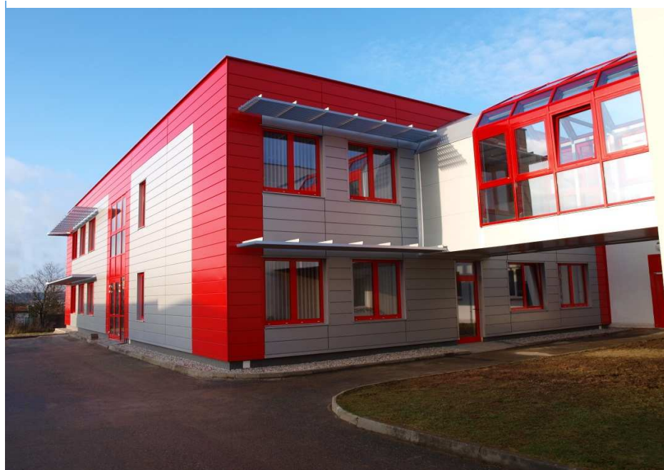
Obr.2 Nová laboratorní budova s pracovišti pro materiálové analýzy a počítačové modelování