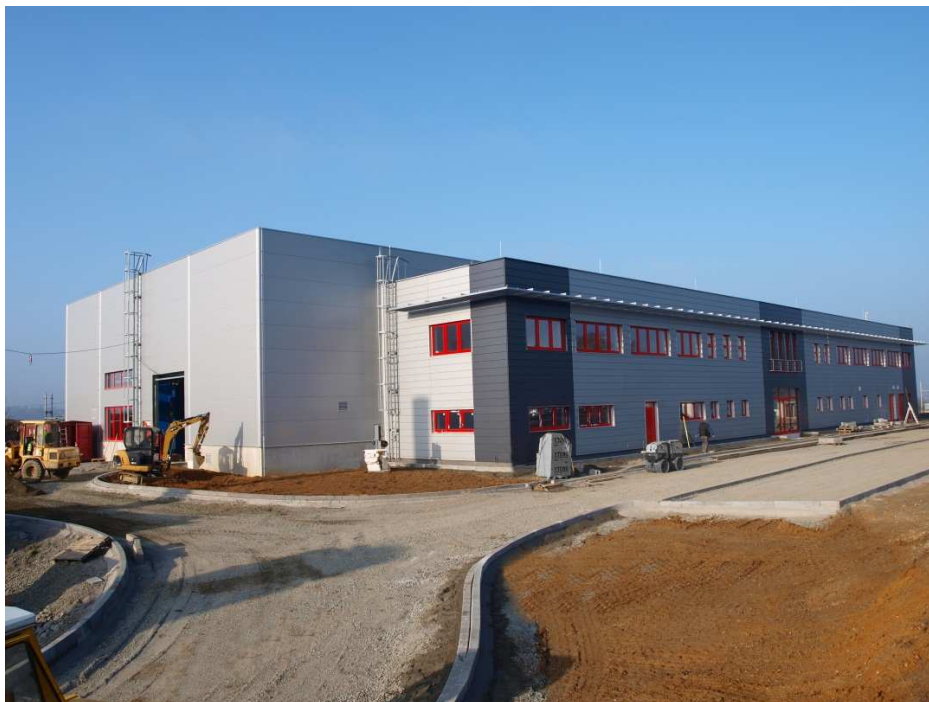
Obr.3 Metalurgická hala