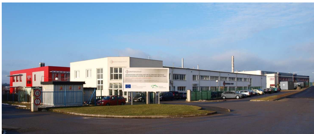
Obr.1 Celkový pohled na Západočeské materiálově metalurgické centrum v Dobrušce